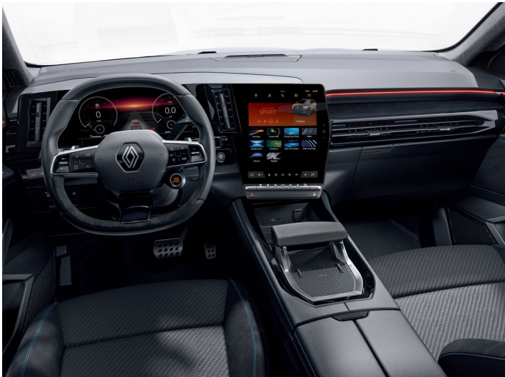
techno esprit alpine