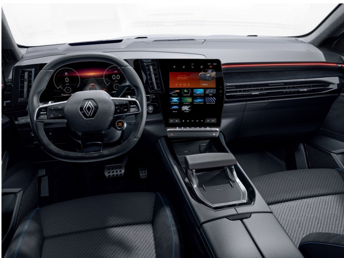
iconic esprit alpine