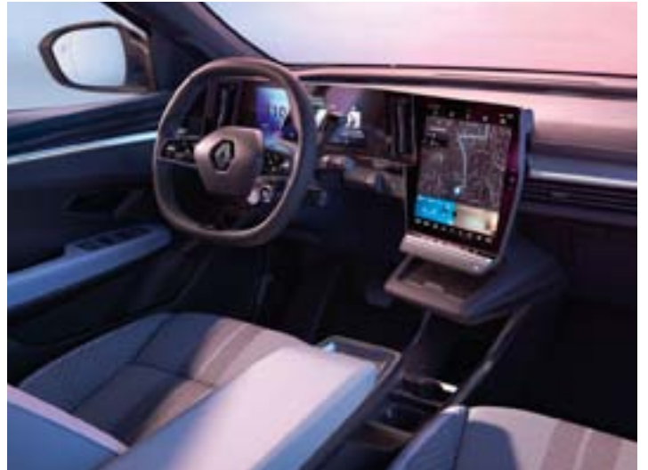
techno - option iconic