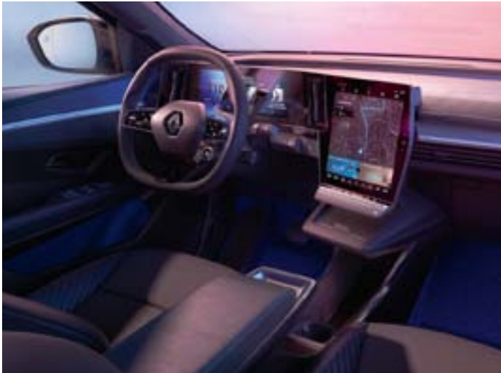
techno - option esprit Alpine